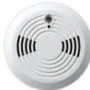
Rivelatore di fumo (MG-SD738)