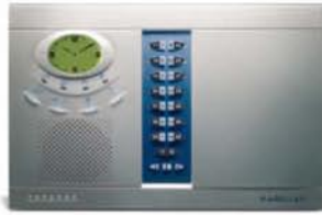
Centrale senza fili Magellan (MG-6160)