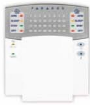
Tastiera senza fili con indicatori LED 32 zone e sportello verticale di pro- tezione dei tasti (MG-32WK)